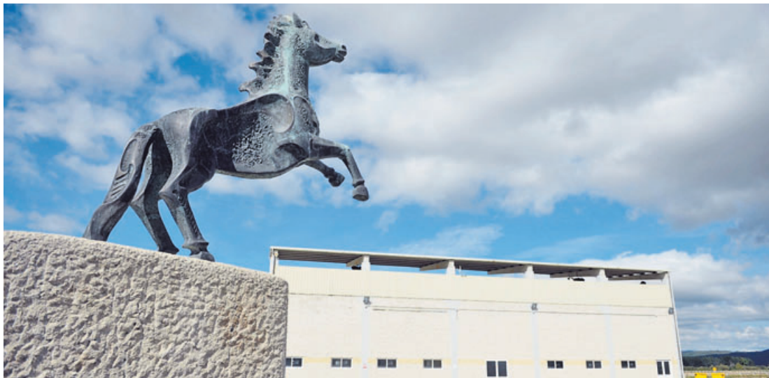
El hipódromo de Xinzo de Limia fue inaugurado en el 2002 y ahora la Diputación ourensana pretende externalizarlo.