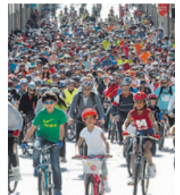
Vigo, ayer. XOÁN CARLOS GIL

Dos hombres de unos 60 años fueron atropellados cuando caminaban por el arcén de la avenida de Culleredo, en Loureda (Arteixo), a primera hora de la mañana de ayer. Ambos fueron trasladados al Chuac, en A Coruña, donde permanecen ingresados en estado grave. El conductor dio negativo en el control de alcoholemia.